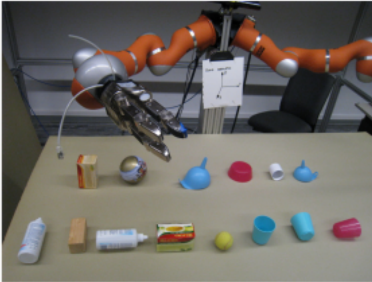
Abbildung 1: Robin und seine Gegenstände

Erstens ist es unnötig schwierig, komplexe Zusammenhänge auf einen Schlag zu lernen. Vielmehr lernt man einfache Konzepte zuerst, um darauf aufbauend komplexere Konzepte zu lernen. Gewissermaßen werden komplexe Konzepte, auf der Basis bereits gelernter Konzepte ausgedrückt, ihrerseits zu einfachen Konzepten. Für Robin ist es relativ schwierig, zu lernen, welche Gegenstände sich auf welche anderen Gegenstände stapeln lassen. Wenn er jedoch vorher gelernt hat, wie Form und Verhalten eines Objekts zusammenhängen – indem er einzelne Objekte mit dem Finger antippt und deren Reaktion beobachtet – dann wird das Stapelverhalten von Objektpaaren viel leichter lernbar.