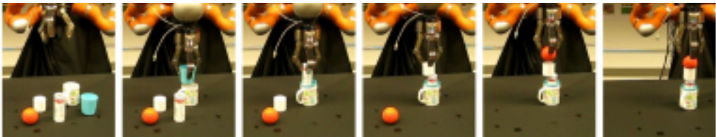
Abbildung 3: Robin baut einen Turm

Im dritten Schritt werden diese Regeln dem Planungsalgorithmus des Roboters zur Verfügung gestellt (Ugur & Piater 2015). Nun kann man ihm Aufgaben stellen, wie z.B. Baue einen möglichst hohen Turm! oder Baue einen möglichst kompakten Stapel! Robin ist nun in der Lage, solche unterschiedlichen Aufgaben zu erfüllen, unter Verwendung der Gegenstände, die er vor sich auf dem Tisch findet (Abb. 3). Dies wird auch mit Gegenständen funktionieren, die er noch nie zuvor gesehen hat, jedenfalls in dem Maße, wie die gelernten Assoziationen zwischen Form und Verhalten auch für diese gelten. Ferner wird der Roboter auf Basis des Gelernten, ohne weiteres Training, dank der symbolischen Abstraktion eine Vielzahl weiterer Aufgaben lösen können, die sich anhand derselben Regeln charakterisieren lassen – dies ist der zweite Meilenstein zum automatischen Wissenserwerb durch autonome Roboter.