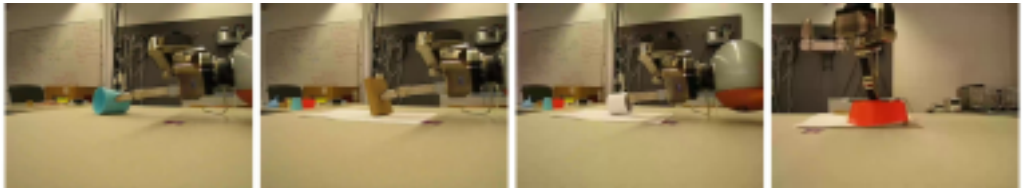
Abbildung 2: Robin tippt Gegenstände an, um zu lernen, wie ihr Verhalten mit ihrer Form zusammenhängt

Robin lernt also in drei Schritten, wie er aus den gegebenen Gegenständen Türme bauen kann. Im ersten Schritt tippt er einzelne Gegenstände wiederholt von drei Seiten an: von vorne, von der Seite, und von oben (Abb. 2). Dabei beobachtet er (mit seiner RGB-D Farb- und Tiefenbildkamera), wie sich der Gegenstand jeweils verhält. Untereinander ähnliche beobachtete Rohdaten fasst er zu einem qualitativen Verhalten zusammen, das schließlich in Symbolform repräsentiert wird. Die beobachteten Verhaltensweisen fallen, mit menschlichen Worten ausgedrückt, in vier Kategorien: (1) das Objekt rutscht mit dem Finger, (2) es rollt davon, (3) es bewegt sich überhaupt nicht, ohne dem Finger Widerstand entgegenzusetzen, oder (4) es bewegt sich nicht, widersteht aber dem Finger (nur beim Antippen von oben).